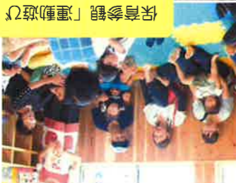
保育参観「運動遊び・フォトルーム作り