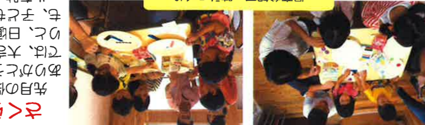
保育参観で、時計づくり

雨の日が続き戶外活動がなかなか出来ませんが室内で元氣いっぱいです。 先月の保育参観では、親子陶芸教室や茶話会にも沢山の方に参加して頂きありがとうございました。陶芸教室では親子で力を合わせて楽しそうな姿が見られて良かったです。出来上がりから楽しみ食べたくてウズウズしています。キュウリも収穫して食べました。今月からプールが始まります。また、七夕会や夏祭りなど楽しい行事もありますので体調を整え夏の暑さにまけないようにしていきたいと思ひます。