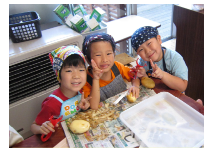
ジャガイモの皮むきに挑戦！