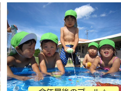
今年最後のプール☆