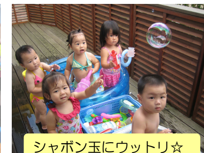
シャボン玉にウツトリ☆