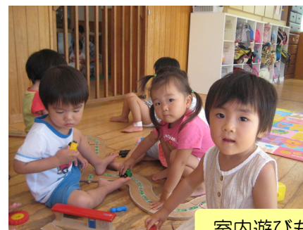
室内遊びも楽しんでます