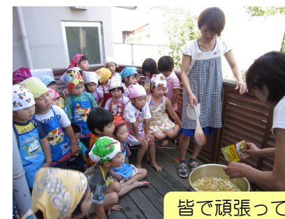
皆で頑張って作りました！！ おいしかったね♥